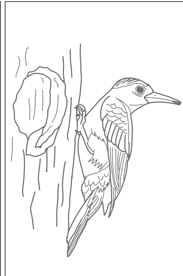
鳥 (ノグチゲラ・野口啄木鳥)