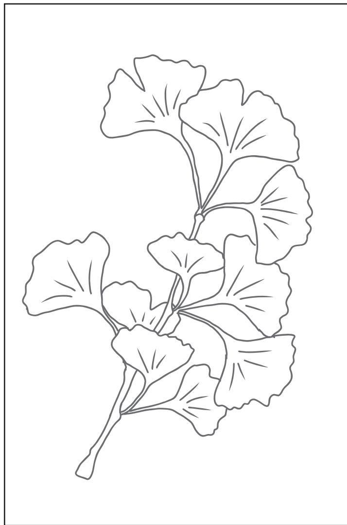
木 (イチョウ・銀杏)