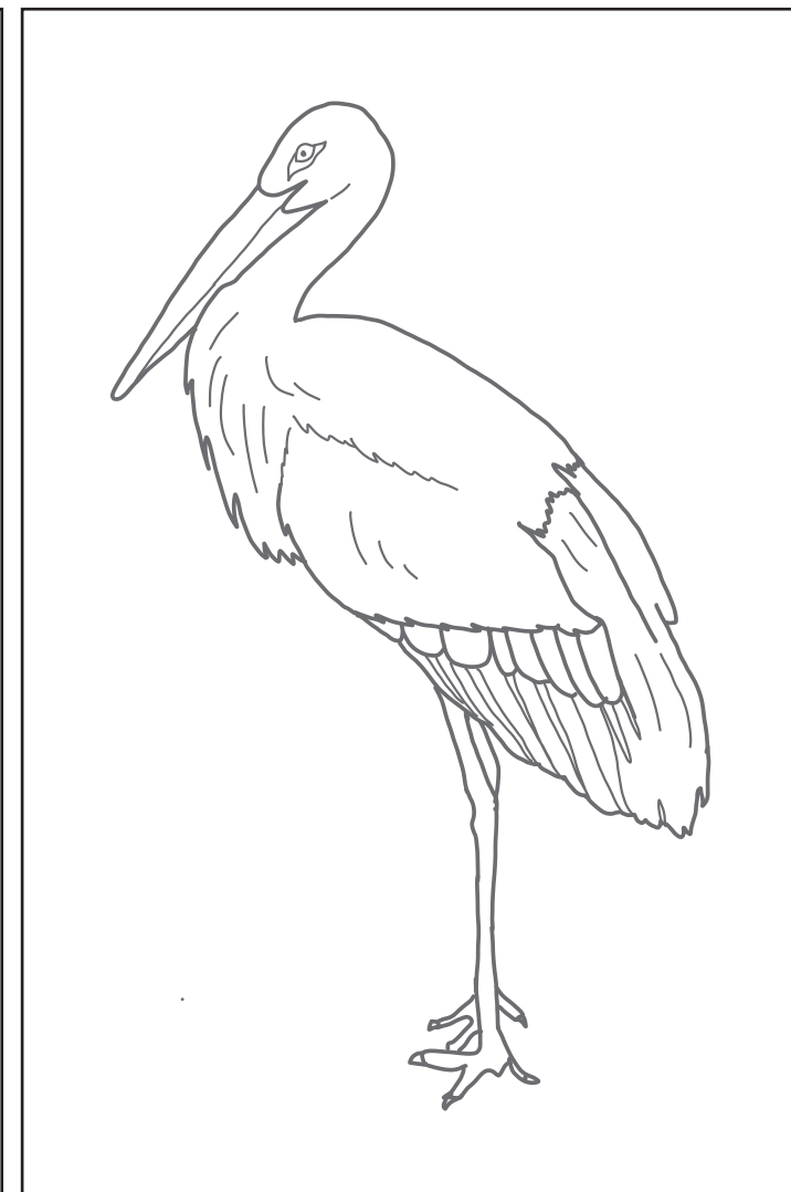
鳥(コウノトリ・鶴 / 鵠の鳥)